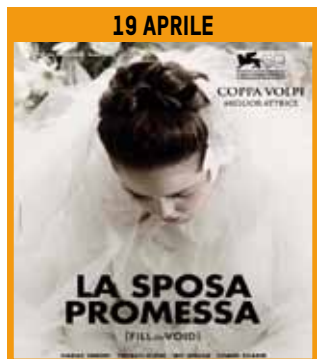
LA SPOSA PROMESSA

OGNI VENERDÌ DIAMO SPAZIO AL CINEMA D'AUTORE INIZIO ORE 21.30