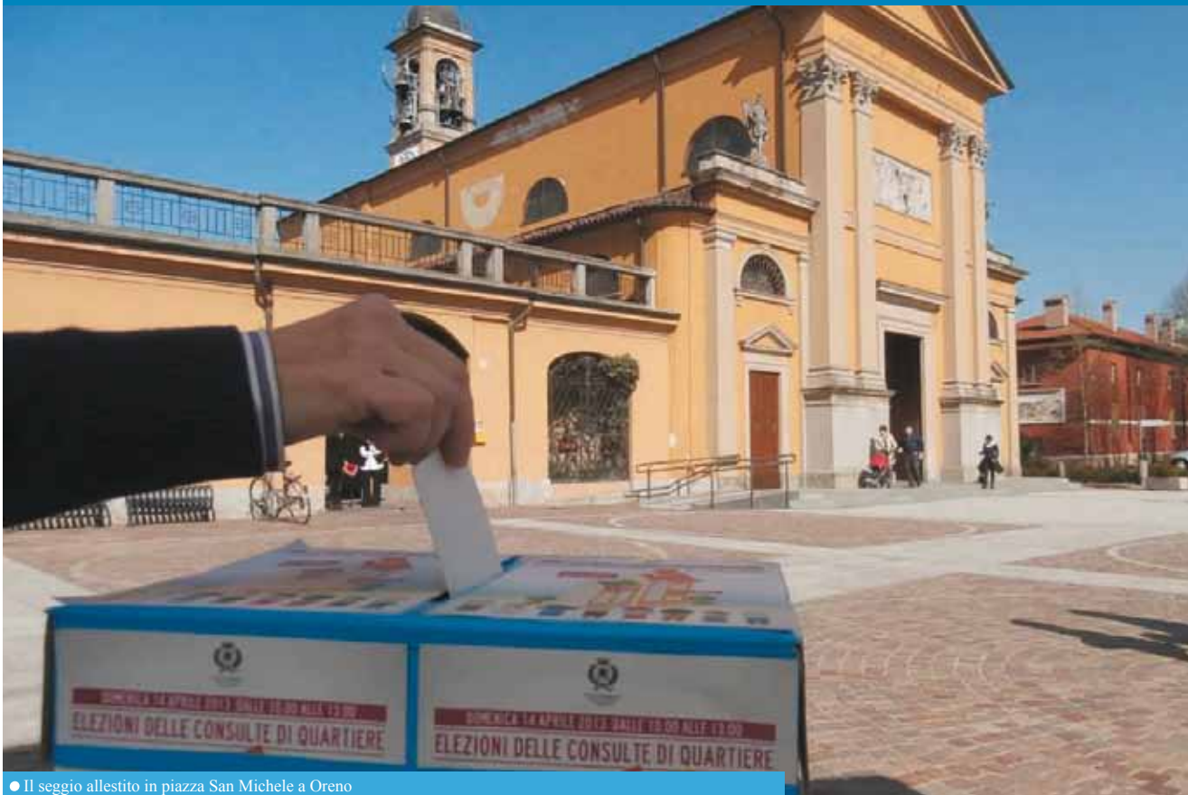
● Il seggio allestito in piazza San Michele a Oreno