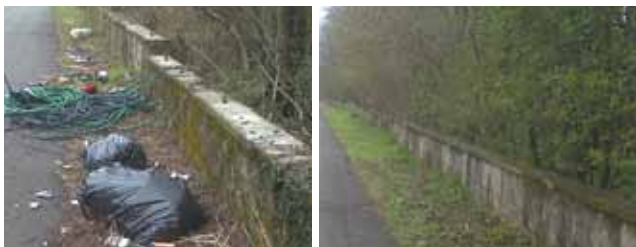
● Via delle quattro strade, al confine con Arcore, prima e dopo la cura

Può capitare di trovarsi con in mano una lattina vuota e di domandarsi se vale la pena compiere il piccolo sforzo di scendere al piano terra e buttarla nel bidone del multipak. Può capitare, anche se si ha un forte senso civico, di domandarsi se il nostro sforzo sarà in qualche modo premiato, o se sarà reso vano dal fatto che “tanto poi gli altri la differenzia non la fanno”, o che “tanto poi i rifiuti li ributtano tutti insieme”. Questo articolo ha il preciso scopo di convincervi che i piccoli sforzi di ciascuno di noi,