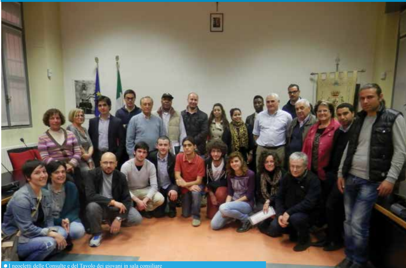
● I neoeletti delle Consulte e del Tavolo dei giovani in sala consiliare