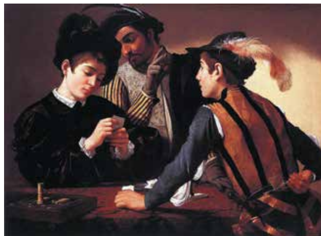
● I Bari, Caravaggio 1594

Anche la nostra Provincia è alle prese con questo fenomeno e nel 2012 l'ASL di Monza e Brianza ha seguito 119 pazienti per gioco d'azzardo patologico con un'età media di 51,7 anni; 14 di questi sono del distretto del vimercatese.