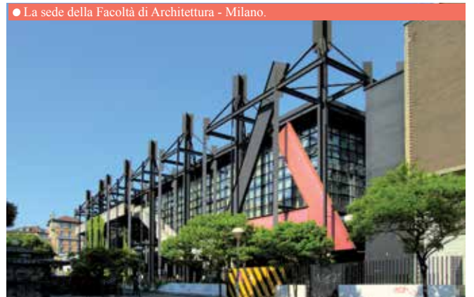
● La sede della Facoltà di Architettura - Milano.

principio passe-partout per il raggiungimento della qualità abitativa, capace di incidere trasversalmente sulla fruibilità, agevolando la variabilità d'uso e l'adattabilità degli spazi; sull'abitabilità, migliorando il benessere sociopsico-fisico degli utenti; sull'economicità di gestione attraverso una facilitata ed economica azione trasformativa-manutentiva, ispezionabilità degli impianti e degli elementi tecnici; sul basso impatto ambientale grazie all'ottimizzazione delle risorse impiegate per la realizzazione, il funzionamento e la dismissione del manufatto.