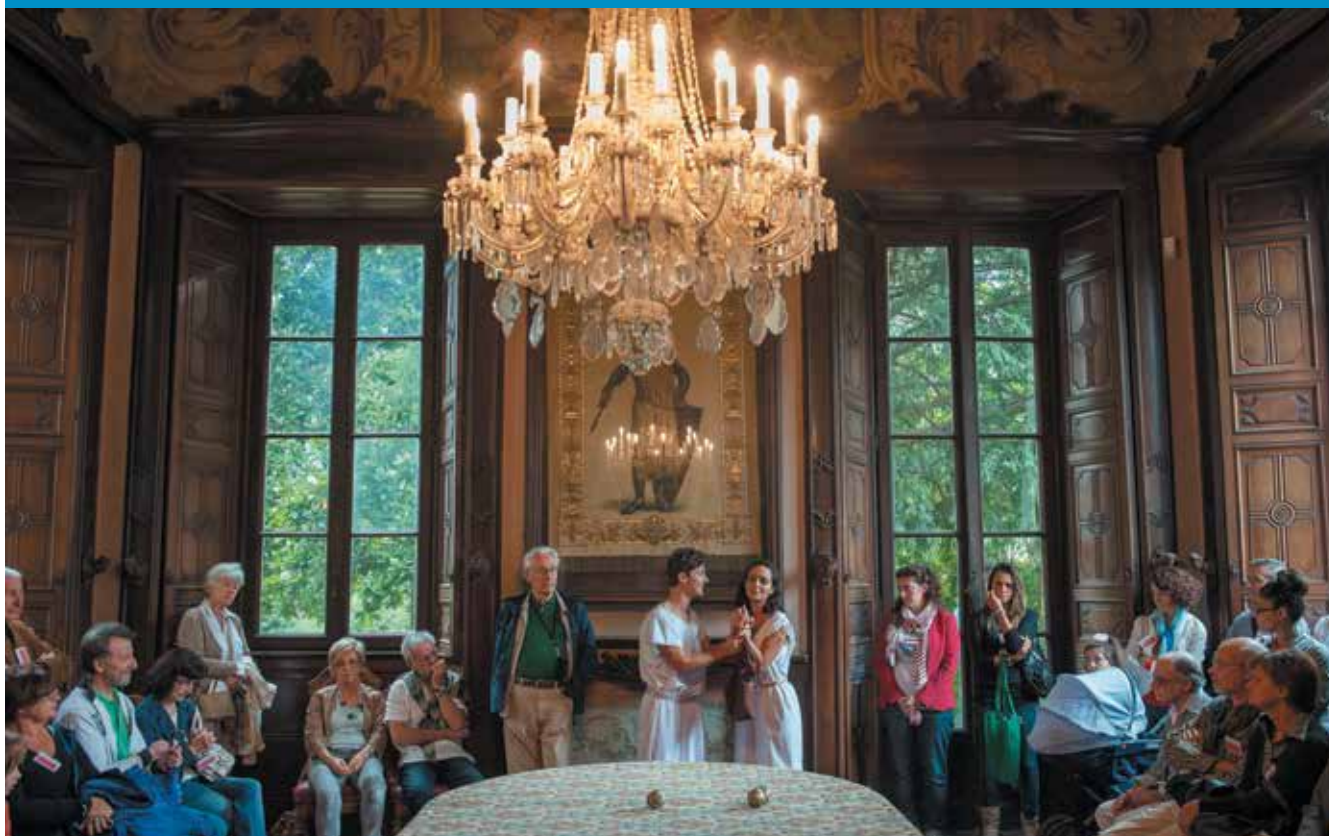
● Nella foto un momento dell'iniziativa "Al banchetto degli dei: gli affreschi viventi di Palazzo Trotti"

Ancora un trionfo per Ville Aperte: a Vimercate oltre 2.000 visitatori