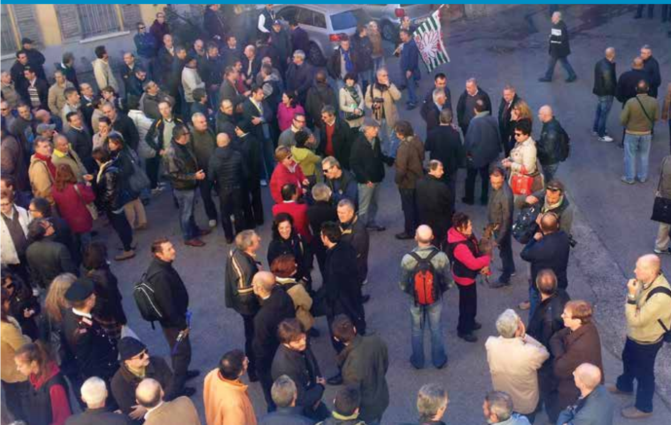
● Nella foto i lavoratori di Alcatel Lucent riuniti nel cortile di Palazzo Trotti per un incontro con il Sindaco