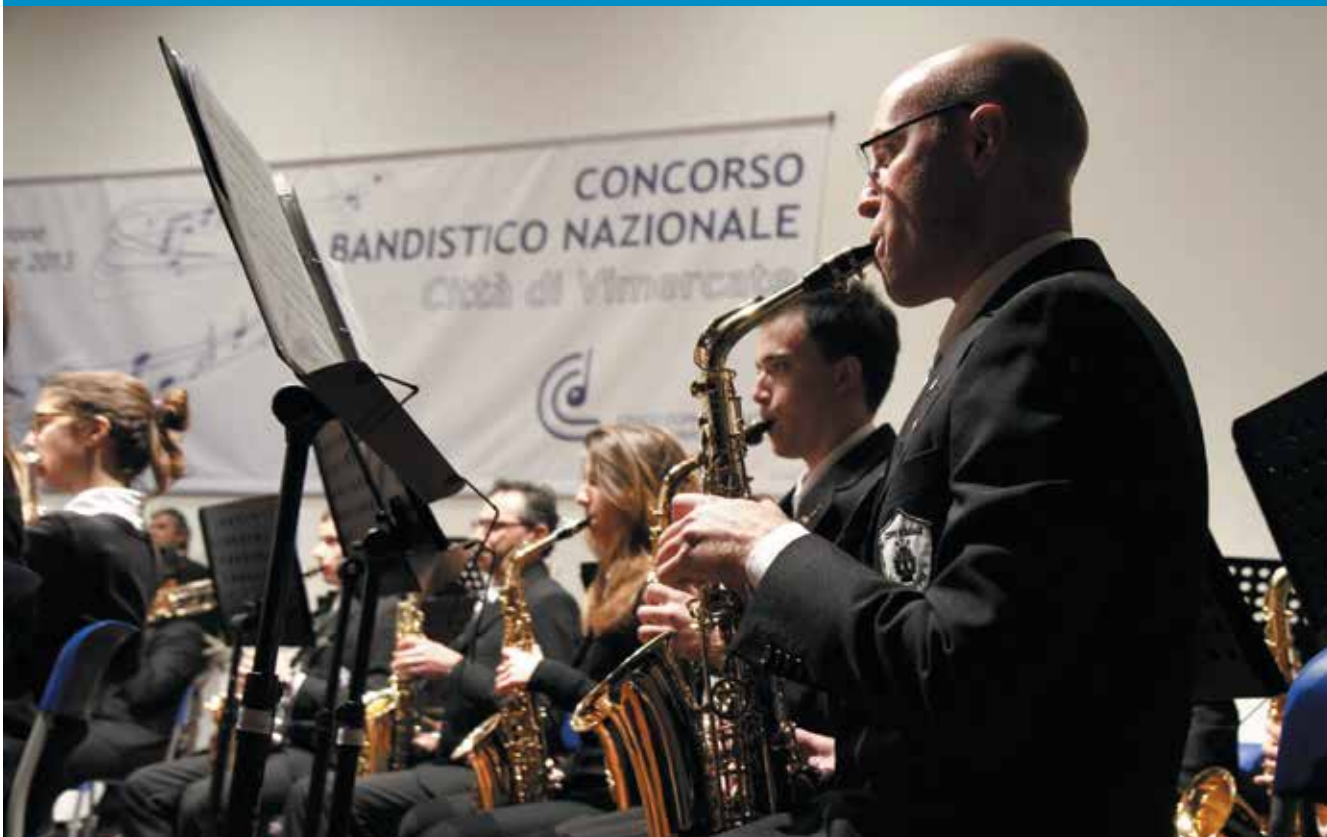
● Nella foto l'esibizione di un corpo bandistico