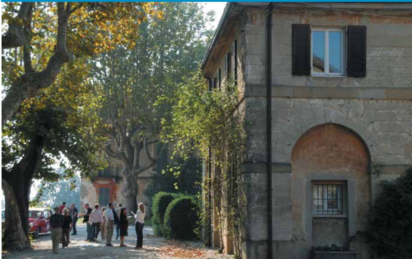
Villa Greppi di Monticello, la prima tappa della rassegna T+uristi a km zero

È cominciata la nuova edizione di Turisti a Km Zero