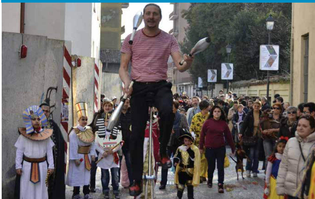
I giocolieri hanno intrattenuto i bambini durante il corteo