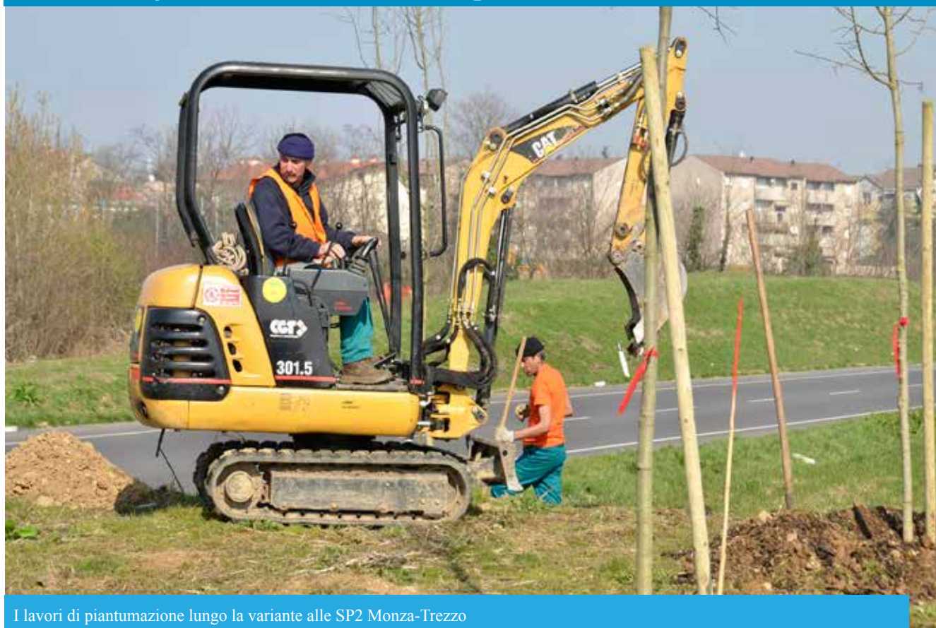
I lavori di piantumazione lungo la variante alle SP2 Monza-Trezzo