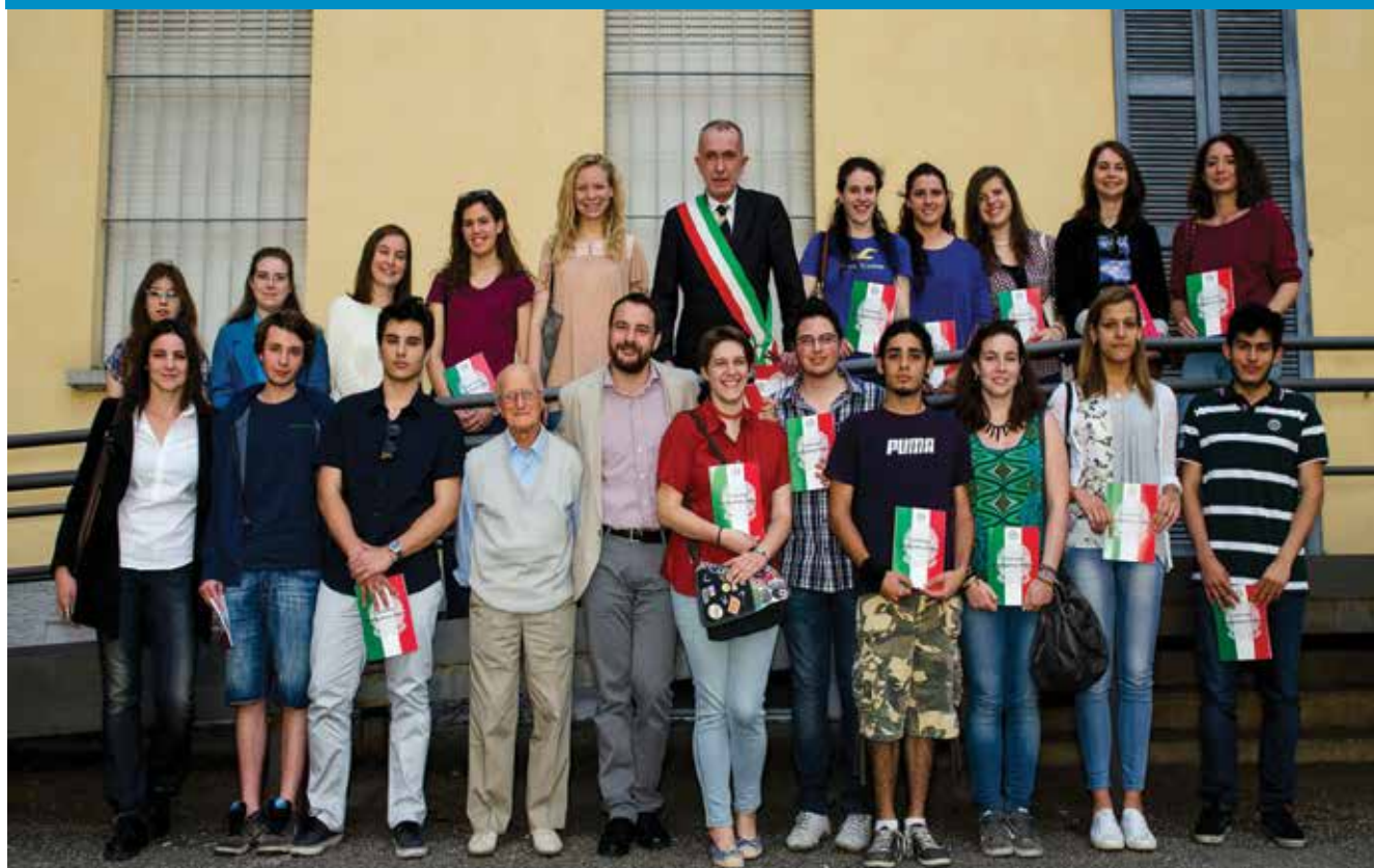
Una foto di gruppo con le autorità

La costituzione a diciottenni e neo cittadini