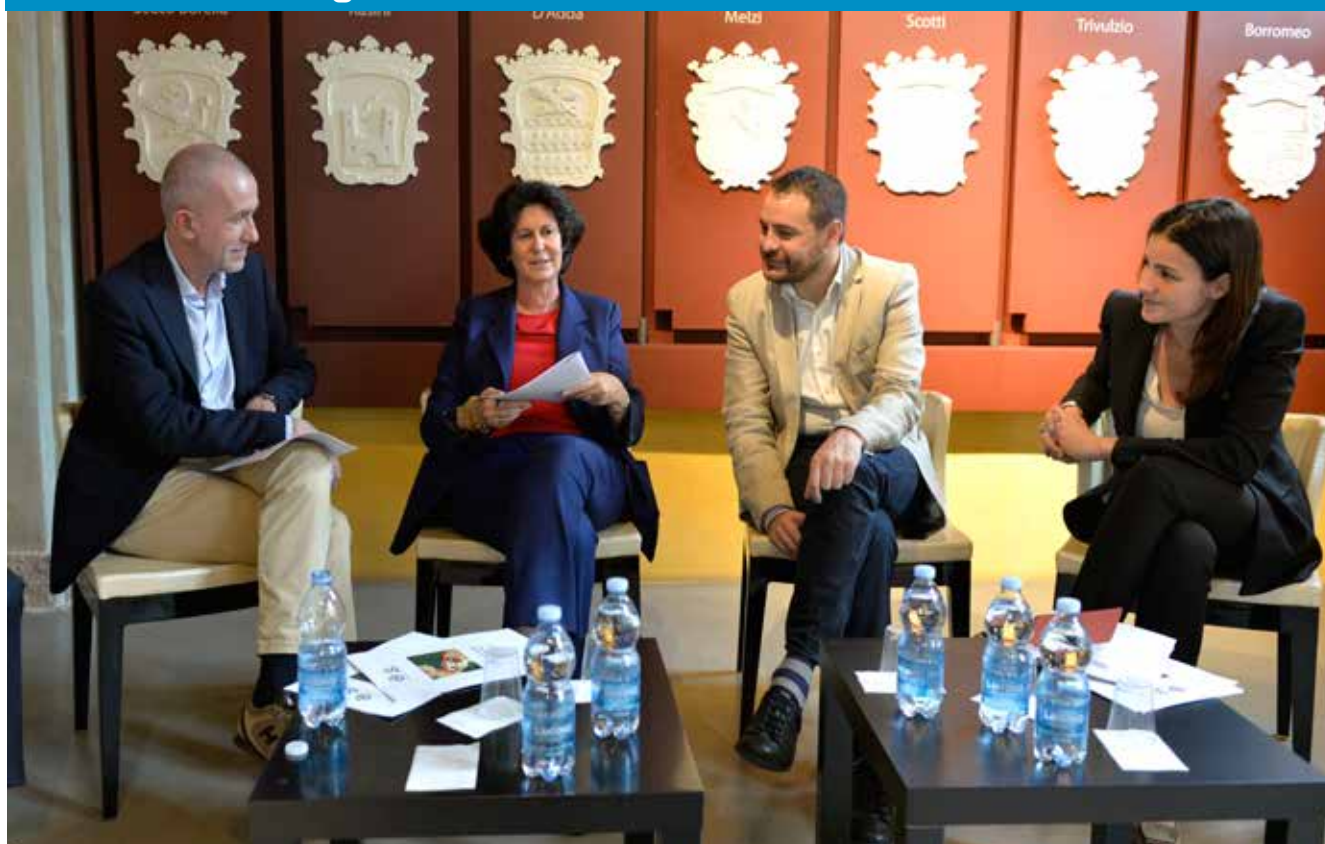
Un momento dell'incontro

Visita del Sottosegretario dei Beni e delle Attività Culturali e del Turismo.