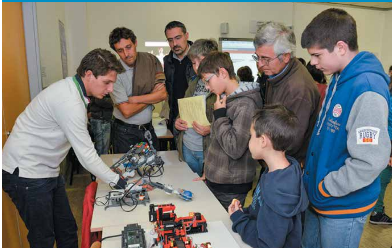
Nella foto una delle attività presentate durante la giornata dell'orientamento