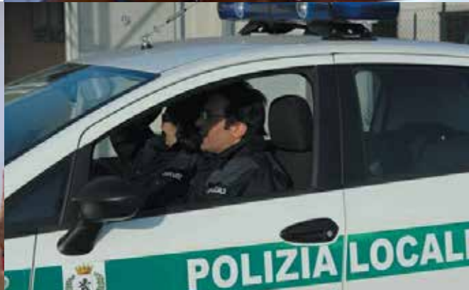
Nelle foto il logo dell'Unione, la firma dell'Atto Costitutivo, la prima seduta del Consiglio e la nuova Polizia Locale