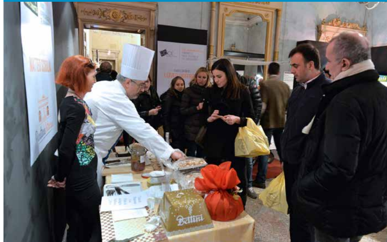
Nella foto uno dei momenti della degustazione dei panettoni artigianali