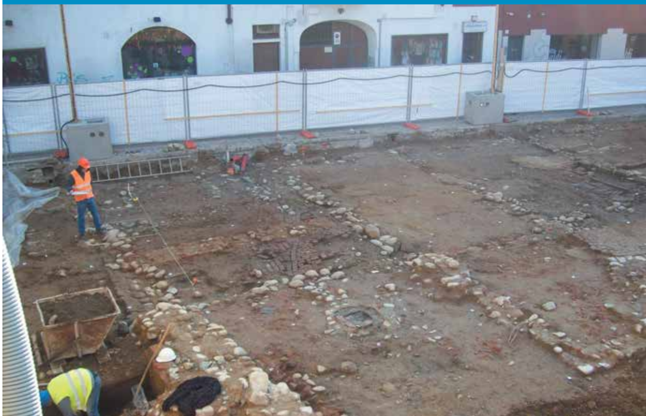
Nella foto l'area di cantiere interessata dagli scavi.