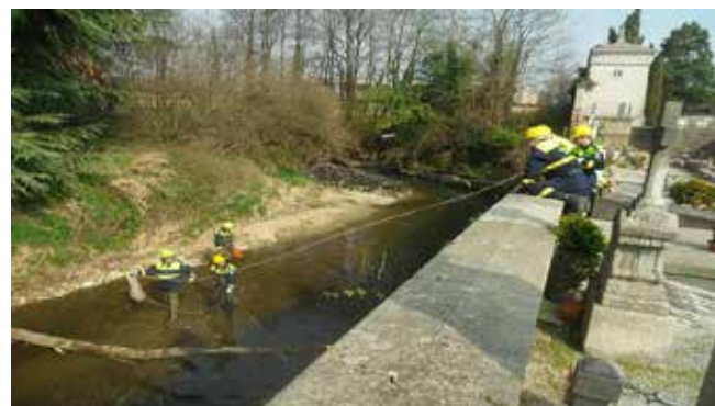
I volontari durante la rimozione degli alberi dal greto del torrente