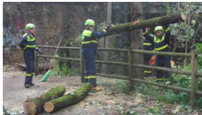
I volontari durante la pulizia delle sponde del Molgora

L'ultimo periodo invernale è stato caratterizzato da modeste precipitazioni nevose che non hanno richiesto l'intervento operativo dei Volontari. Nonostante questo l'attività specifica dei volontari si è concentrata sulla prevenzione con il monitoraggio del territorio comunale e alla preparazione delle attrezzature per l'intervento operativo e allo approvvigionamento e stoccaggio del composto sale/