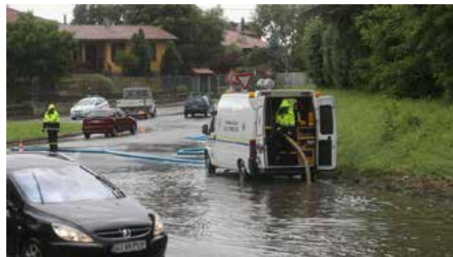
L'intervento dei volontari durante l'esondazione del Molgora