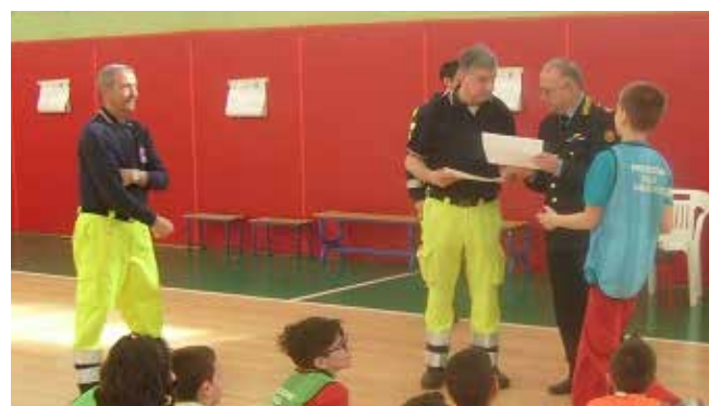
I volontari durante una lezione sulla sicurezza agli alunni