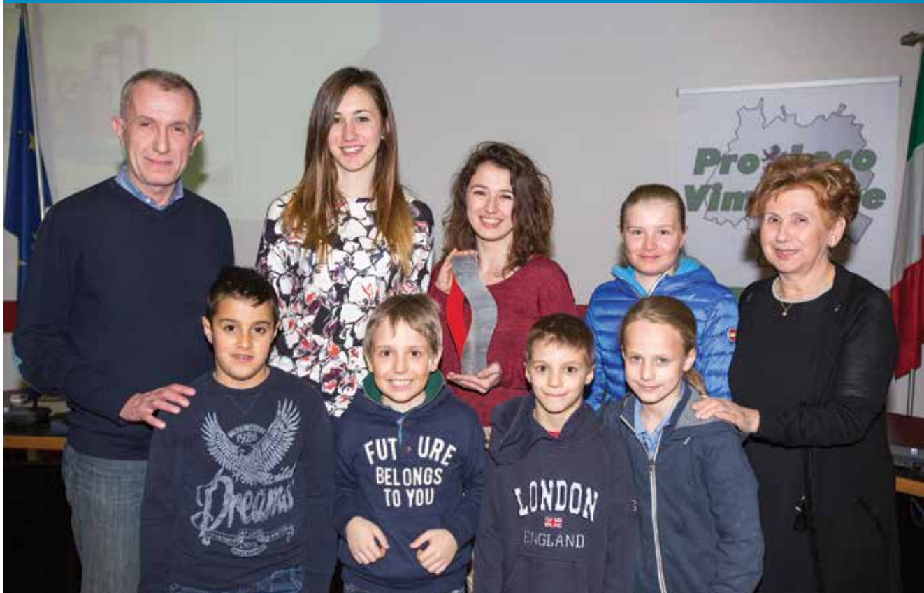
Nella foto alcuni dei premiati del concorso.