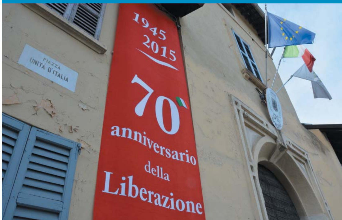
Nella foto lo stendardo celebrativo del 70° anniversario della Liberazione, esposto sulla facciata di Palazzo Trotti

Lo stendardo che celebra la Liberazione sulla facciata di Palazzo Trotti