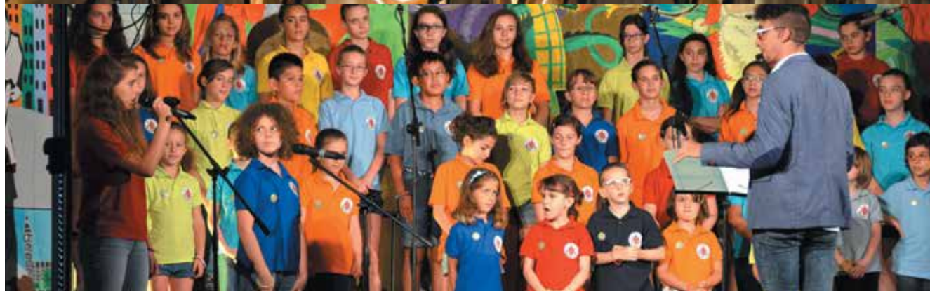
Nella foto l'esibizione dei Cori al Museo e del Piccolo Coro La Goccia