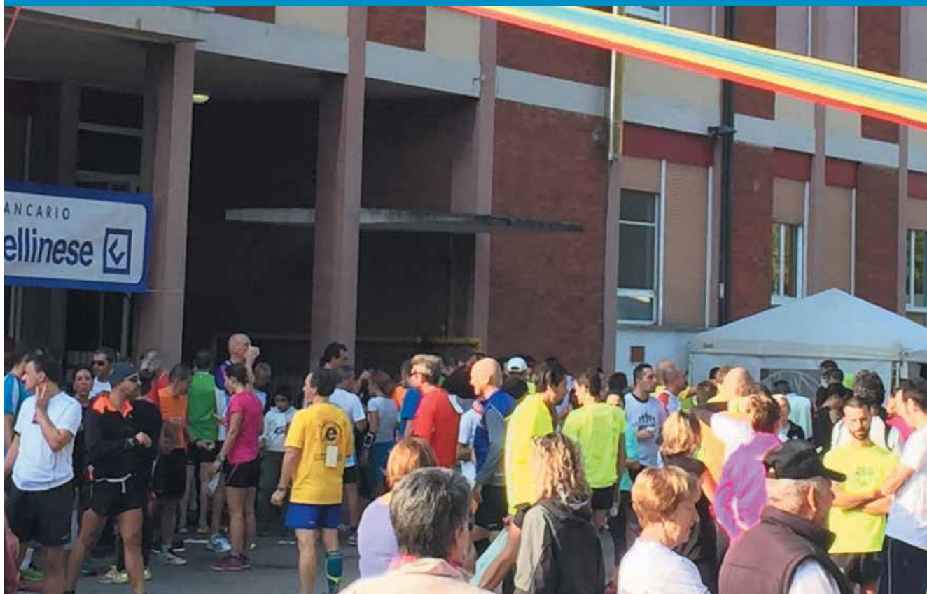
Nella foto i partecipanti alla classica stracittadina