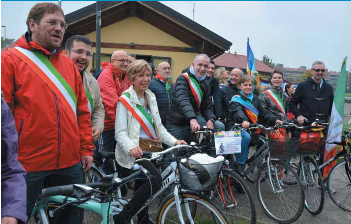
Nella foto alcuni Sindaci dei paesi del Vimeratese giunti alla tappa finale all'Area Feste di Vimercate