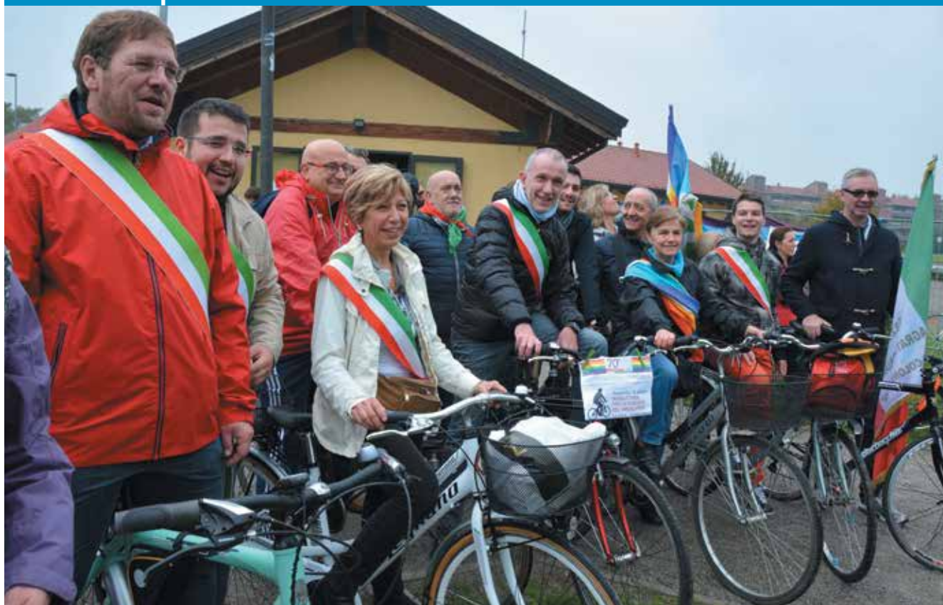
Nella foto alcuni Sindaci dei paesi del Vimeratese giunti alla tappa finale all'Area Feste di Vimercate