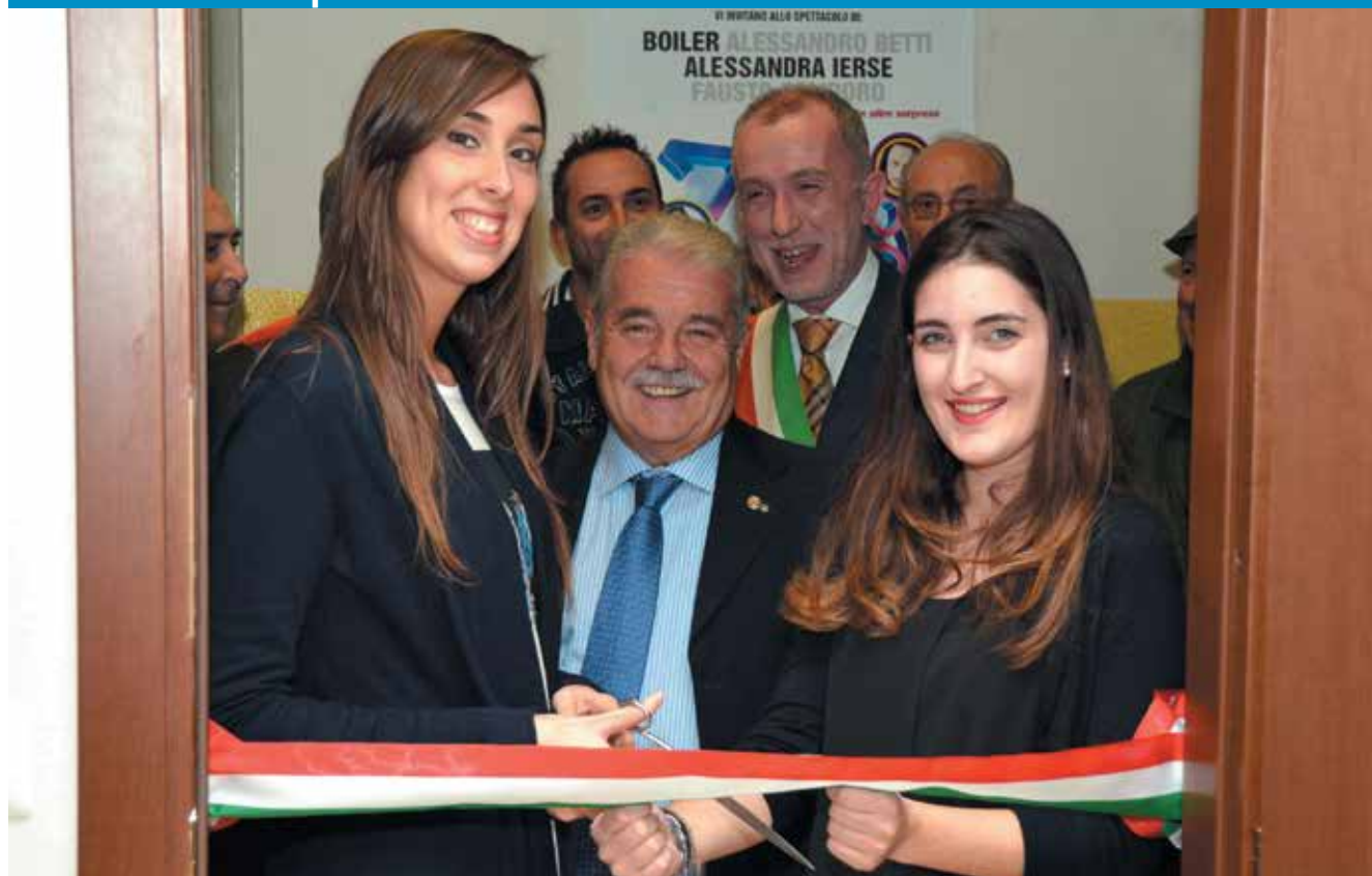
Nella foto il taglio del nastro della nuova sede dell'AVIS Comunale Vimercate

Una nuova sede per l'AVIS Comunale Vimercate.