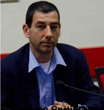
Scrittore (mento, Cinque Stelle) Scrittore all'elenco